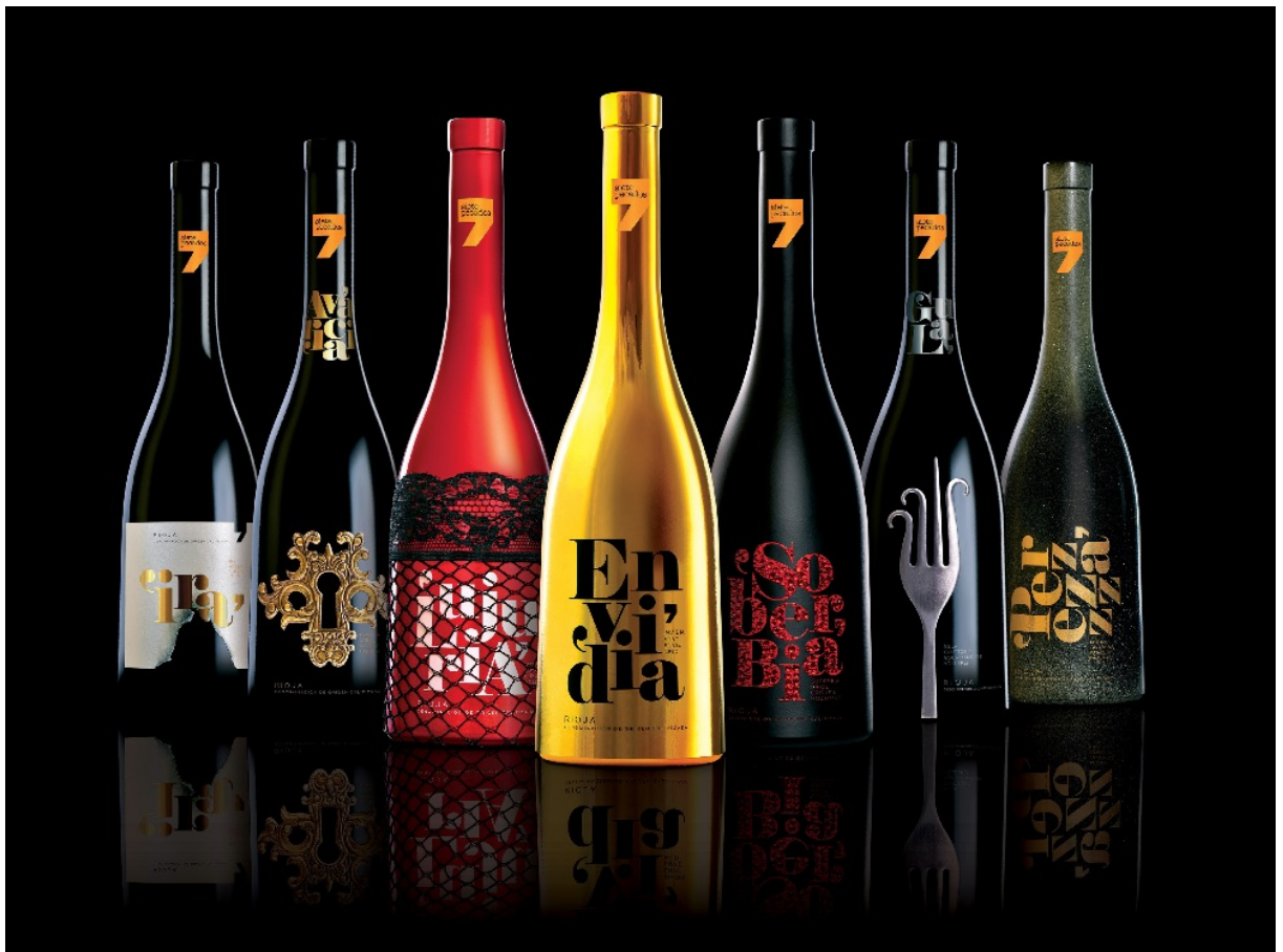
Sidecar Design, «Siete Pecados». CLAP Platinum 2013 para a Melhor Embalagem ou Conjunto de Embalagens.

SidecarDesign (da Espanha) obteve o prêmio CLAP Platinum por seu trabalho «Siete Pecados».