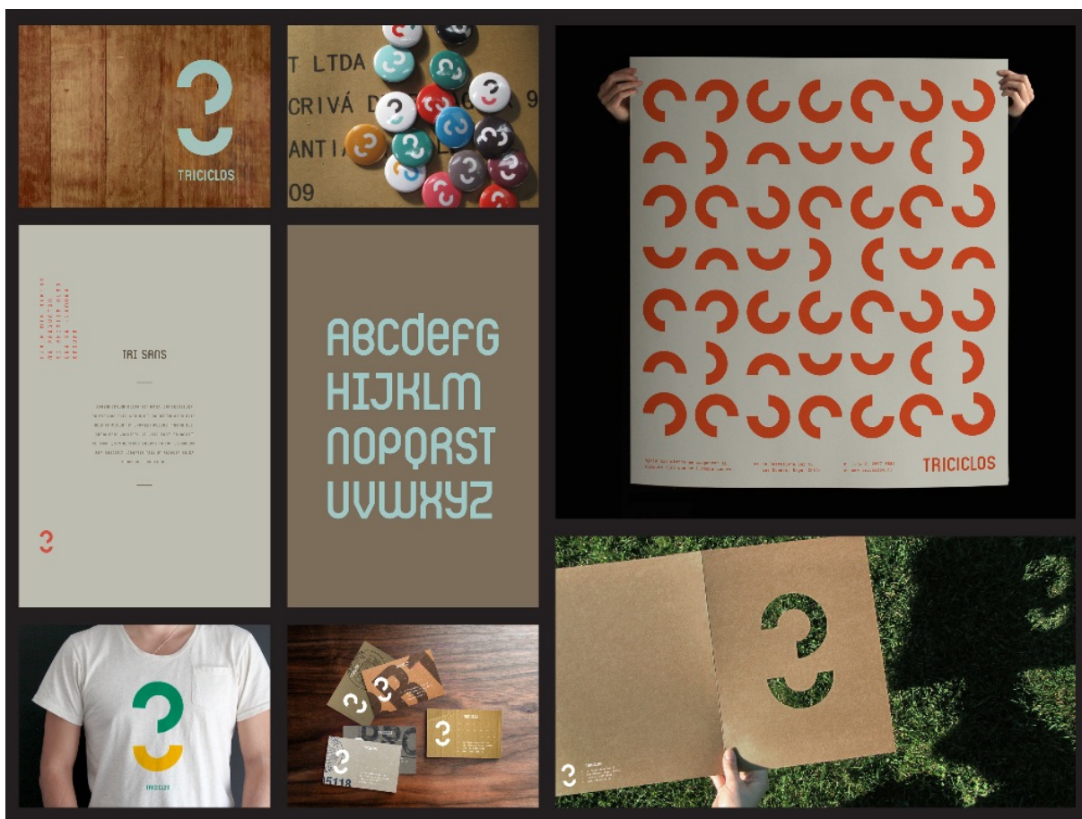
Porta4, «Triciclos». CLAP Platinum 2013 para a Melhor Imagem Gráfica.

Porta4 (do Chile) obteve o prêmio CLAP Platinum por seu trabalho «Triciclos» e um CLAP por «Fifty Films». Por sua vez, Oven Design (da Colombia) obteve um CLAP por seu trabalho para «North Texas Arrhythmia Associates».