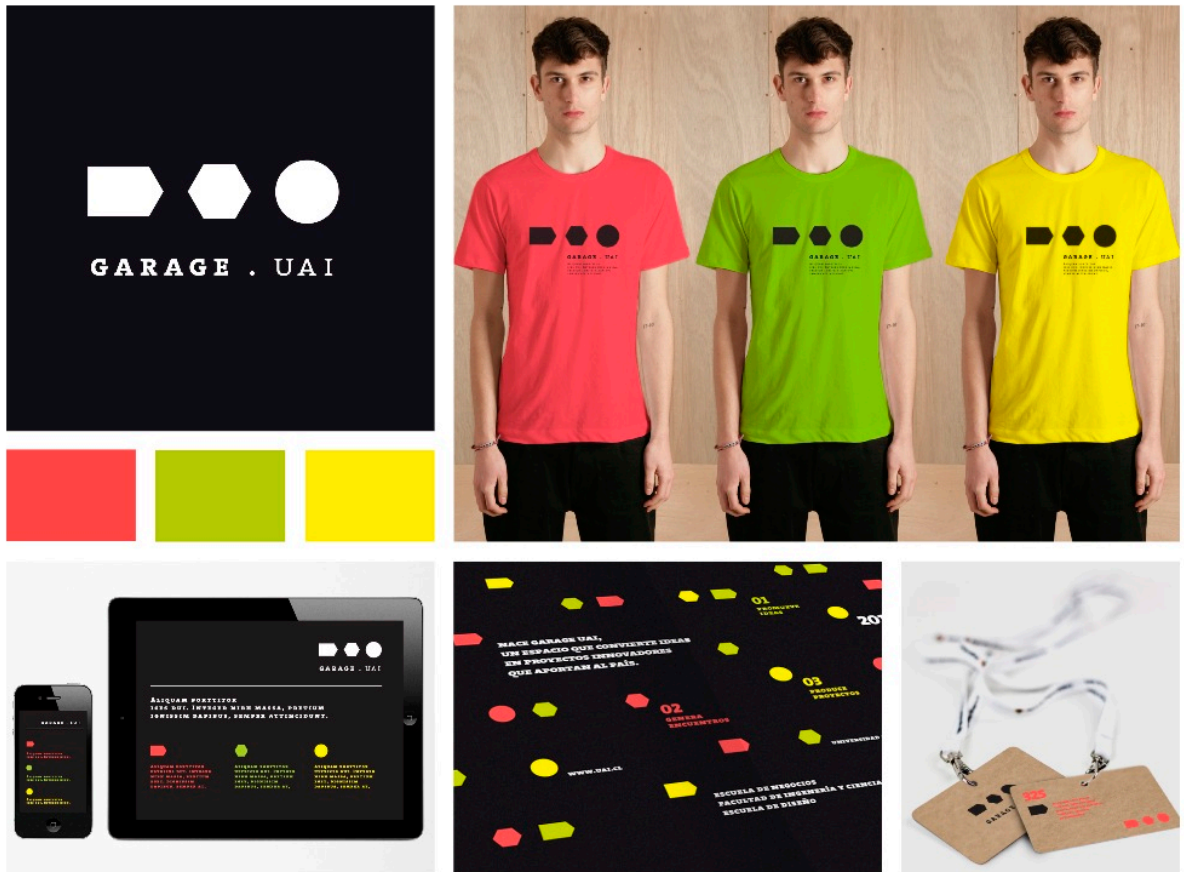
Porta4, «Garage / Universidad Adolfo Ibáñez».CLAP Platinum 2013 para o Melhor Sistema de Identidade Corporativa ou Branding.