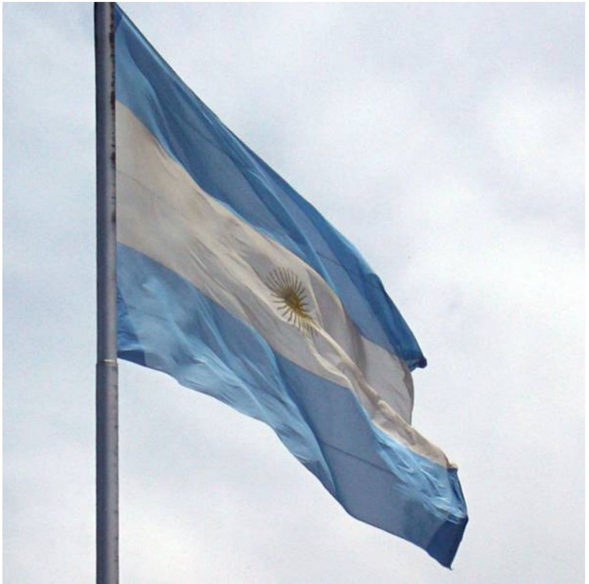
A bandeira argentina

Manuel Belgrano desenhou símbolos conhecidos em todo o planeta e promoveu a formação de artistas visuais. Além de ser um herói da pátria Argentina, Belgrano também merece ser escolhido como patrono do design na América Latina.