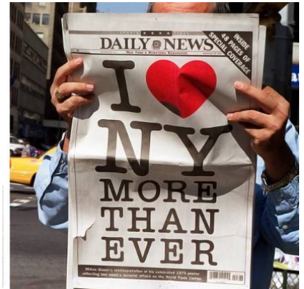
Logo «I Love New York» y adaptación post atentados del 11s.

La permanencia del trabajo de Glaser se evidencia en 2014, cuando diseña la gráfica para la temporada final de la serie televisiva Mad Men. Matthew Weiner, su creador, confesó: «Crecí con un póster de Milton en mi casa, que mis padres compraron en el MoMA». 1