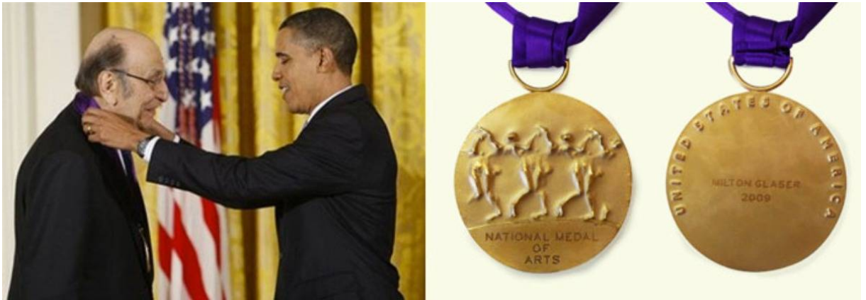
Glaser recibe la Medalla Nacional de las Artes.

Museo Nacional de Diseño Cooper-Hewitt, en 2009 se convirtió en el primer diseñador gráfico en recibir –de manos de Barack Obama– la Medalla Nacional de las Artes.