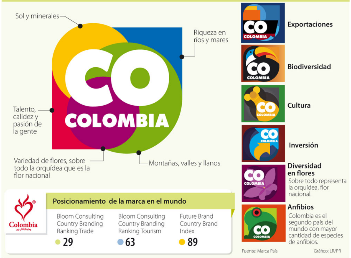
Gráfico extraído del diario La República. Explicaciones varias de conceptos de la marca.

Siguiendo con la variedad de sentidos que se le dan a los colores, veamos la comparación particular de cada uno de los colores compartidos por las dos marcas: