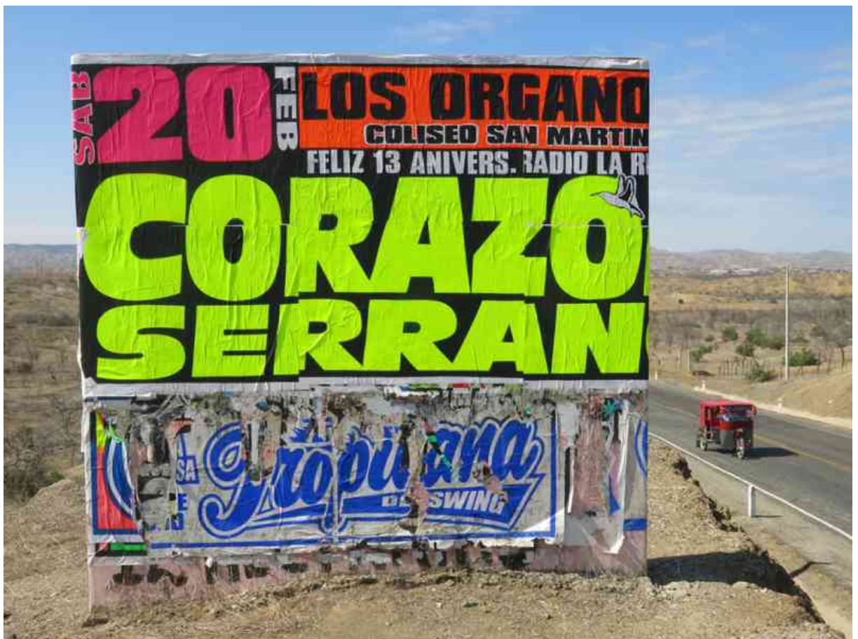
Corazón Guerrero: carteles tipográficos para la promoción de conciertos populares en Perú, Ecuador y Colombia.

Hay un paralelismo con la fotografía, que antes requería, aparte de una sensibilidad especial, un know how técnico y un medio de comunicación muy específico para poder llegar al gran público. Hoy, con un teléfono y las RRSS, las posibilidades crecieron brutalmente. Cualquiera puede hacer una foto que se vuelve viral en cuestión de horas, con millones de reproducciones, y que pasará al olvido en menos de un par de días. Pero pongo en duda que tengan éxito o lleguen a publicarse unos libros del estilo «Lo mejor de la fotografía en Instagram de 2022».