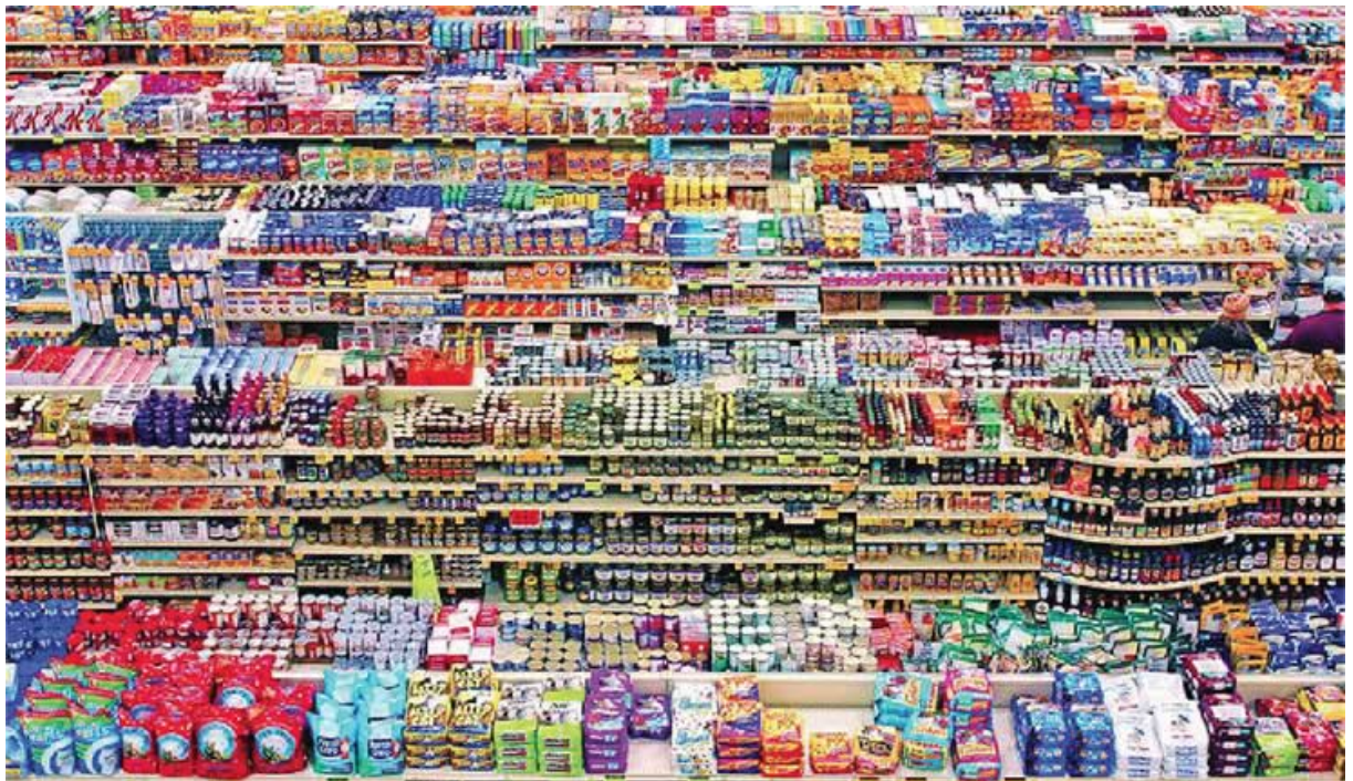
Imagen del famoso fotógrafo alemán Andreas Gursky. Si bien el mensaje apunta a una metáfora de la sociedad de consumo actual, lo cierto es que el escenario expone claramente la alta polución de mensajes en puntos de venta para masivos y la necesidad de crear identidades que sean capaces de sobrevivir y triunfar en la dura lucha por obtener la preferencia del consumidor.

No existe un requisito más buscado por los clientes que la percepción de calidad por parte del consumidor. Las marcas para productos masivos se mueven en contextos de alta competencia. Por lo tanto, su aporte de valor resultará fundamental. Incluyo dentro de «valor» a todas las cualidades positivas que logran establecer un plus por sobre lo existente. Lo cualitativo es un atributo importantísimo, por supuesto, pero no se puede dejar de lado la seducción, la tentación, la diversión, la complicidad, etc.